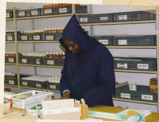
Étiquetage de flacons à l'Abbaye Notre Dame du Désert - 2010.