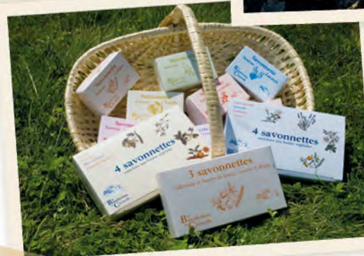
Nos produits phares de l'Abbaye, à leurs débuts.