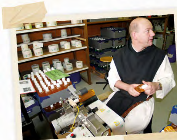
Préparation de colis à l'Abbaye La-Pierre-qui-vire - 2010.